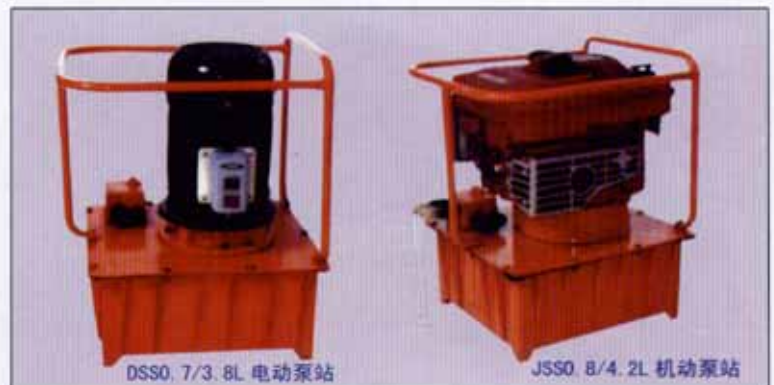
DSS0 7/3.8L 电动泵站