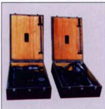
★ 锥度配合油压拆装工具