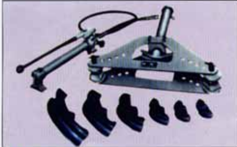
★ WGQ-10 弯管器