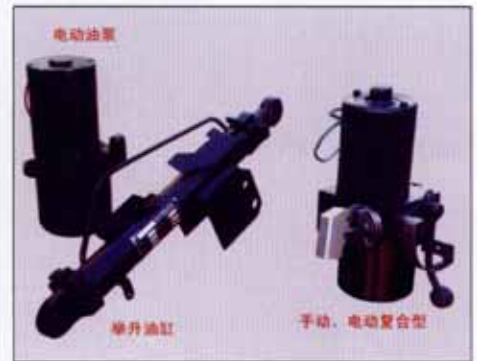
• 汽车驾驶室液压翻转装置 •

缸径: φ35mm 额定压力: 20Mpa 压力: 20Mpa 电动泵额定排量: 0.16ml/r 推力: 19.2KN 手动泵排量: 1.2ml/p.s 杆径: φ25mm 油箱容积: 0.7L 行程: 305/290mm 电机: 0.75KW DC24V 拉力: 9.2KN